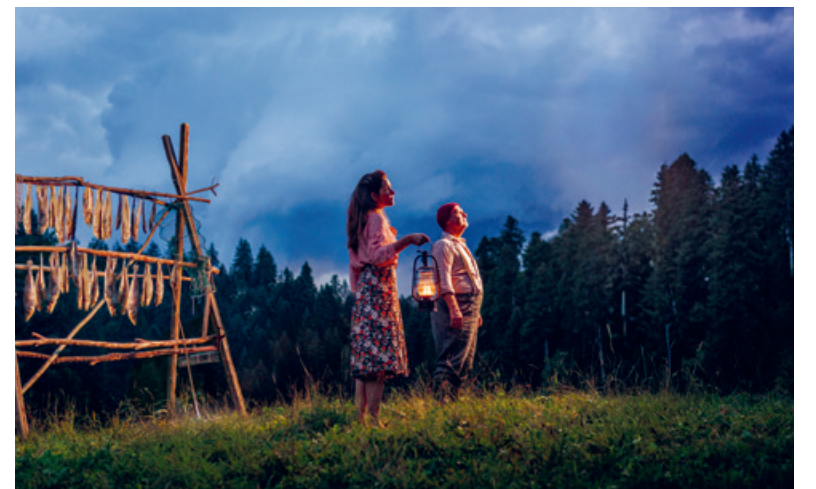
Die Inszenierung mit rund 40 Schauspielenden wird in der stimmungsvollen Naturkulisse im Schnittweier Steffisburg aufgeführt.

Tickets sind erhältlich unter www.theaterwelten.ch . Der Vorverkauf startet am 27. Februar.