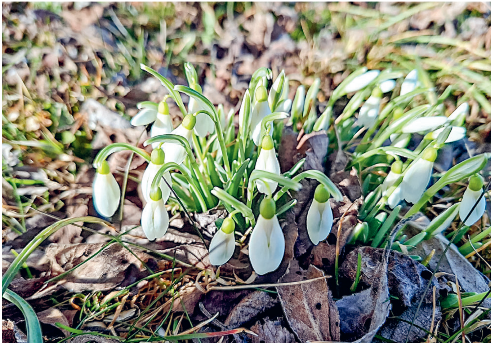
Ein Hauch von Frühling im Februar: Im Zulgtal öffnen die ersten Schneeglöckchen früh ihre weissen Blüten und durchbrechen das noch winterliche Laub. Die zarten Pflanzen trotzten den kühlen Nächten und bringen erste Farbtupfer in die Landschaft. Ihr Erscheinen deutet darauf hin, dass der Frühling in diesem Jahr nicht mehr allzu weit entfernt ist, auch wenn der Kalender noch Winter anzeigt.

Mit der Solargemeinschaft Schönau verankert die Net Zulg AG die erneuerbare Energieproduktion direkt in der Region und ermöglicht der Bevölkerung eine aktive Beteiligung an der Energiewende in Steffisburg. Die technischen Risiken, beispielsweise wetterbedingte Produktionsschwankungen oder vorübergehende Ausfälle, werden vollständig von der Net Zulg AG getragen.