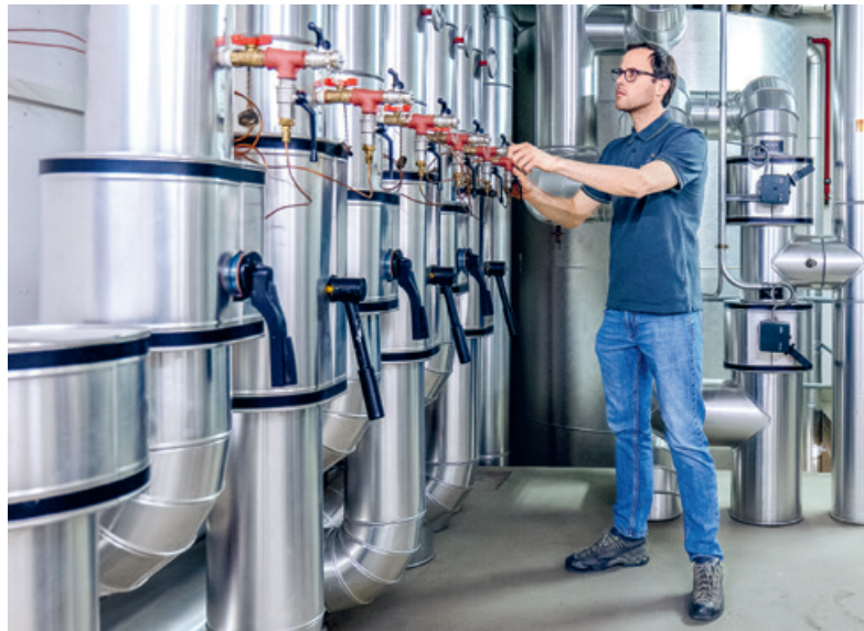
Ein Mitarbeiter der Net Zulg AG kontrolliert die Wärmeübergabestation Glockenthal.