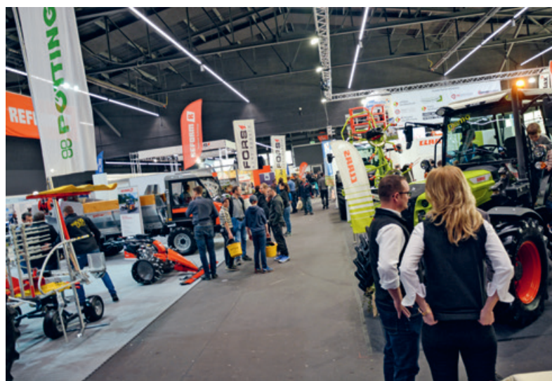
An der Agrimesse warten rund 200 Ausstellende auf Besucherinnen und Besucher.

Die Agrimesse auf dem Expo-Gelände in Thun ist vom 26. Februar bis 1. März täglich von 9 bis 17 Uhr geöffnet. Die Eintrittspreise betragen für Erwachsene 8 Franken, Jugendliche bis 16 Jahre geniessen Gratis Eintritt. Gratisparkplätze stehen zur Verfügung. Von dort fahren Pendelbusse zur Messe. Signalisation beachten. Anreise mit dem öffentlichen Verkehr der STI Linie 6 ab Bahnhof Thun. sku Weitere Informationen unter www.agrimesse.ch .