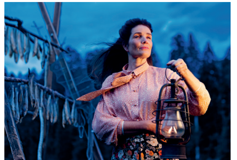
Das Stück erzählt die berührende Geschichte von Finja, die im nordischen Fischerdorf Weierdal lebt.