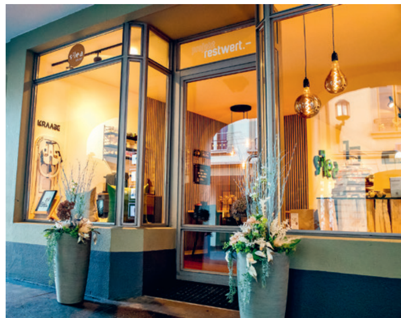
Die Stiftung Silea hat in der Altstadt von Thun eine neue Boutique eröffnet.

Die Stiftung Silea ermöglicht Menschen mit Unterstützungsbedarf an mehreren Standorten Arbeits-, Ausbildungs- und Wohnangebote. Ziel ist es, berufliche Entwicklung und selbstbestimmte Lebensgestaltung zu fördern. In enger Zusammenarbeit mit regionalen Partnern baut Silea ihre Angebote zur beruflichen Integration im Raum Thun seit mehreren Jahren kontinuierlich aus. pd/sku