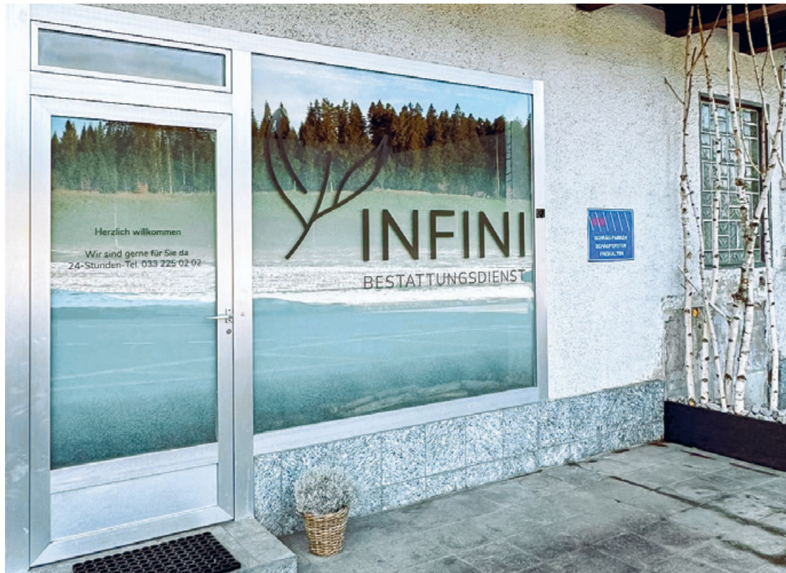
Eingangsbereich zu INFINI in der Schwarzenegg

Seit dem 1. Dezember 2025 ist der INFINI Bestattungsdienst mit einer neuen Filiale in der Schwarzenegg vertreten. Auch wenn der Standort neu ist, gründet das Angebot auf Erfahrung, fachlicher Kompetenz und klar gelebten Werten. Der unabhängige Familienbetrieb begleitet Menschen in schweren Momenten mit Respekt, Würde und persönlicher Nähe.