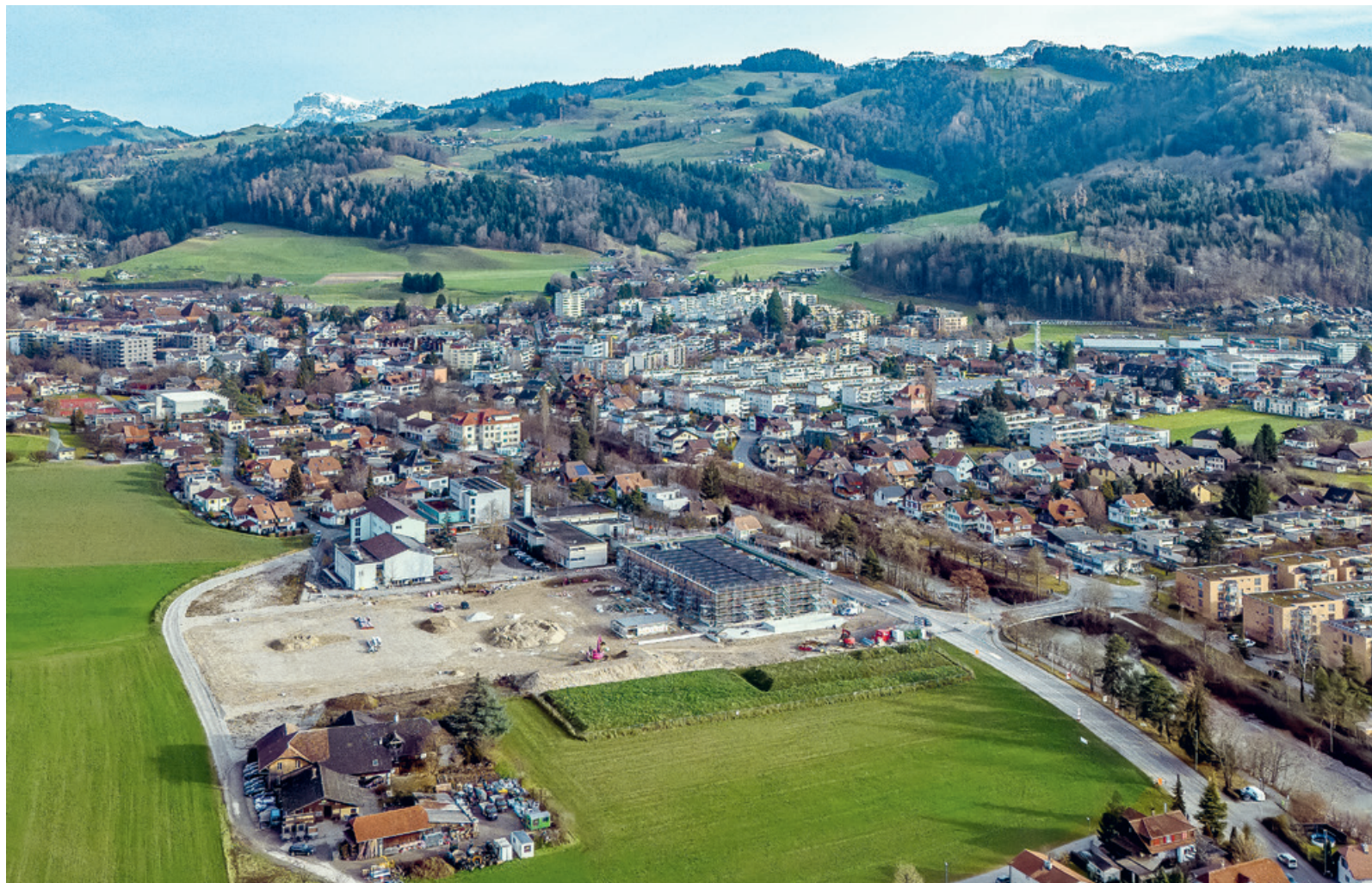
Auf dem Dach der neuen Schul-, Kultur- und Sportanlage Schönau wurde eine Photovoltaikanlage mit einer Leistung von 278 Kilowattpeak installiert.