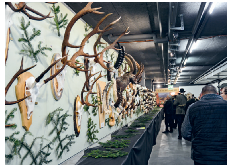
An der Kantonal Bernische Trophäenausstellung waren 306 Ausstellungsstücke zu sehen.

Zwei Pelzhändler vor Ort nahmen sich den aufgeführten Fellen an. Auch dieses Jahr gab es für einen Fuchsbalg erster Qualität 8 Franken. Insgesamt wurden 163 Fuchspelze zu Markte getragen. Die schwierigen Verhältnisse, mit dem letzten grösseren Schneefall im November, führten dazu, dass weniger Felle aufgeführt wurden als letztes Jahr. Die beiden Händler rühmten die Qualität der Felle, die die Jägerinnen und Jäger mit Passion vorbereiteten und aufführten. pd